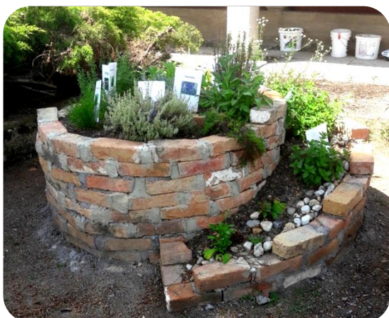
Špirala začinov - Kräuterspirale