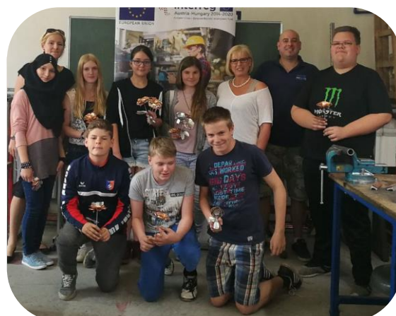
Djelaonica metalom - Metallworkshop