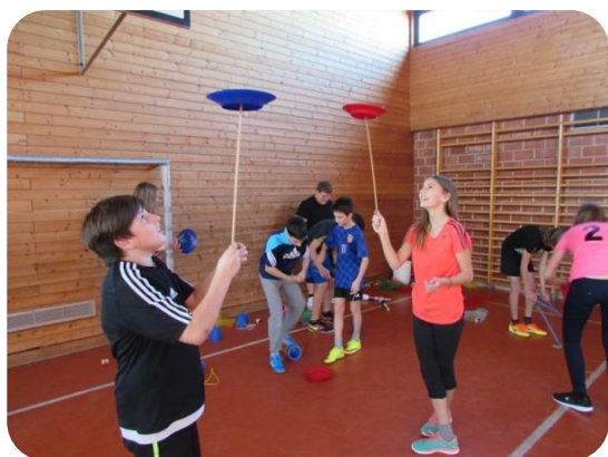
Cirkus u školi – Zirkus macht Schule