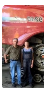
Dani prakse o zvanju – Berufspraktische Tage